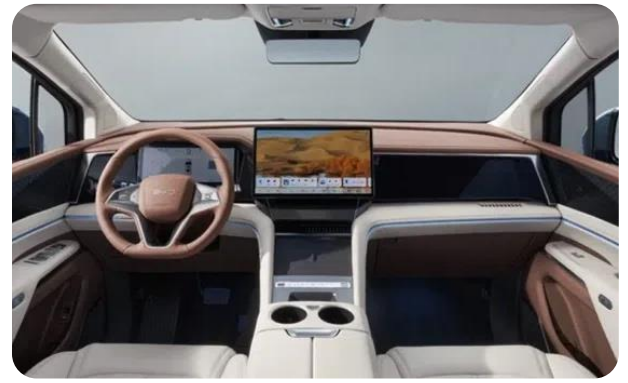
Beige x Brown