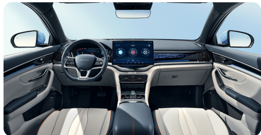
Blue x Grey