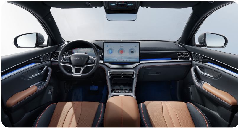
Black x Brown