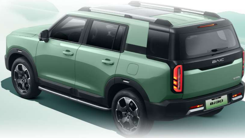
إضاءة جانبية لدائر العجلات Wheel Eyebrow Side Light