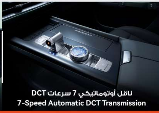
ناقل أوتوماتيكي 7 سرعات DCT 7-Speed Automatic DCT Transmission