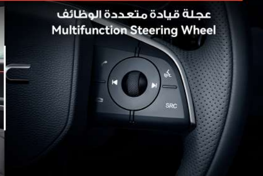
عجلة قيادة متعددة الوظائف Multifunction Steering Wheel