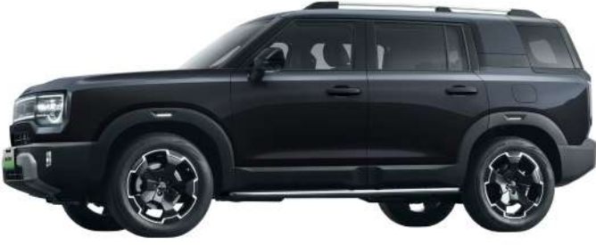
أسود - Jet Black