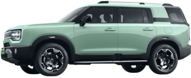
أخضر - Pistachio Green