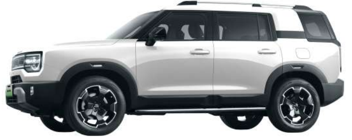
أبيض - Pearl White