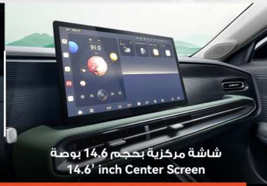
شاشة مركزية بحجم 14.6 بوصة 14.6' inch Center Screen