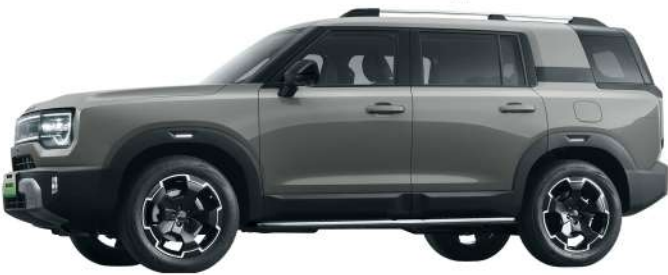
رمادي لامع - Charcoal Grey