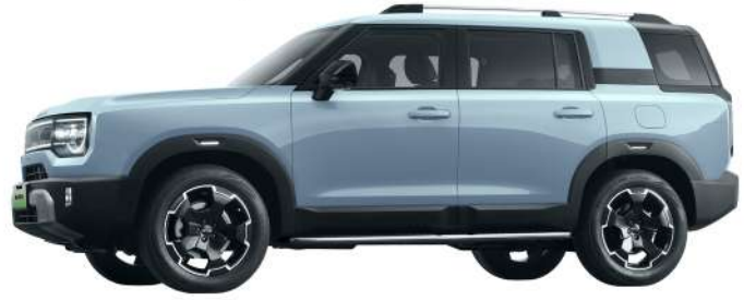
أزرق سماوي - Sky Blue