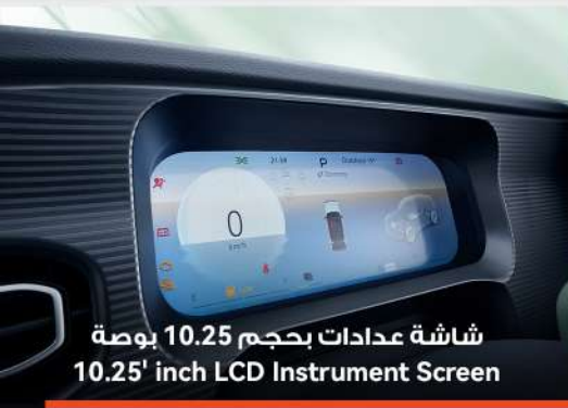
شاشة عدادات بحجم 10.25 بوصة 10.25' inch LCD Instrument Screen