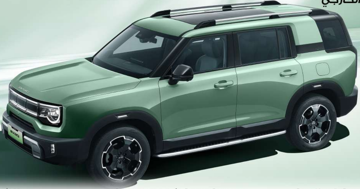
مصباح LED أمامية LED Front Headlight