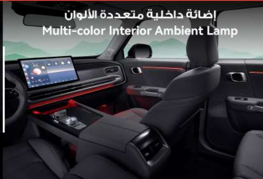
إضاءة داخلية متعددة الألوان Multi-color Interior Ambient Lamp