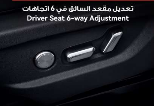
تعديل مقعد السائق في 6 اتجاهات Driver Seat 6-way Adjustment