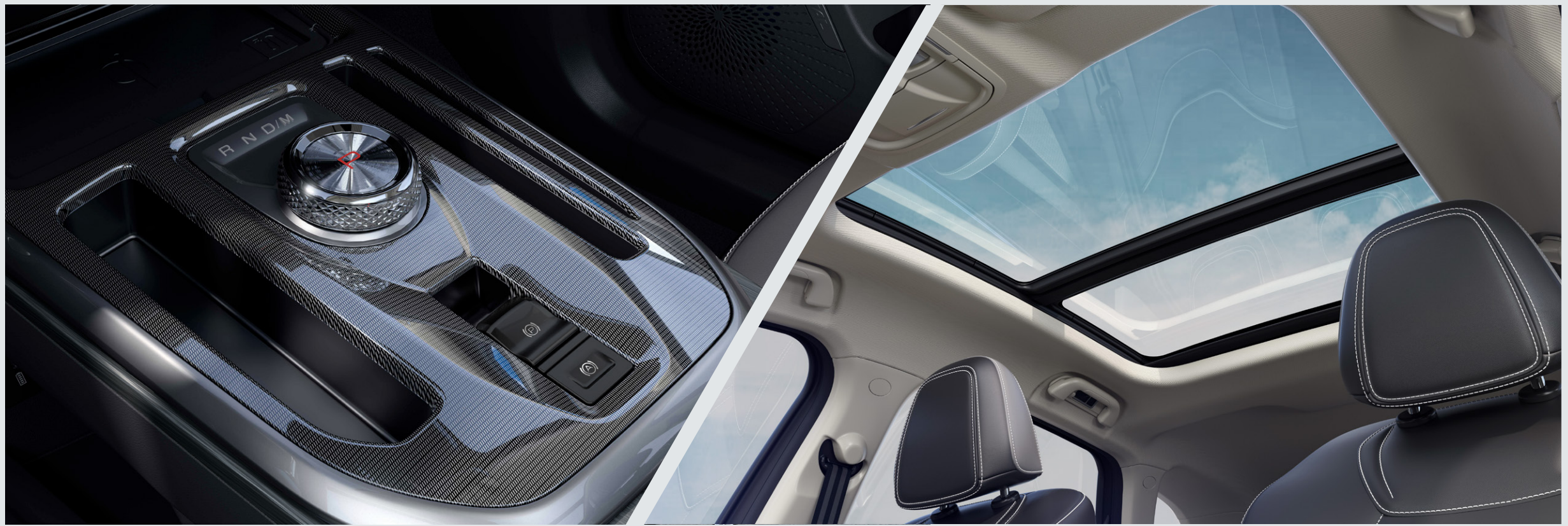
Rotary Gear Shift Dial 7 DCT - wet