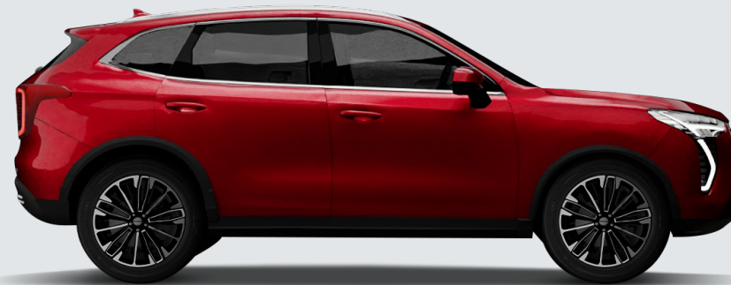
2,700mm Wheel base 4,472mm Length