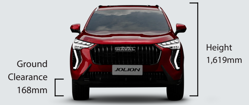
Ground Clearance 168mm