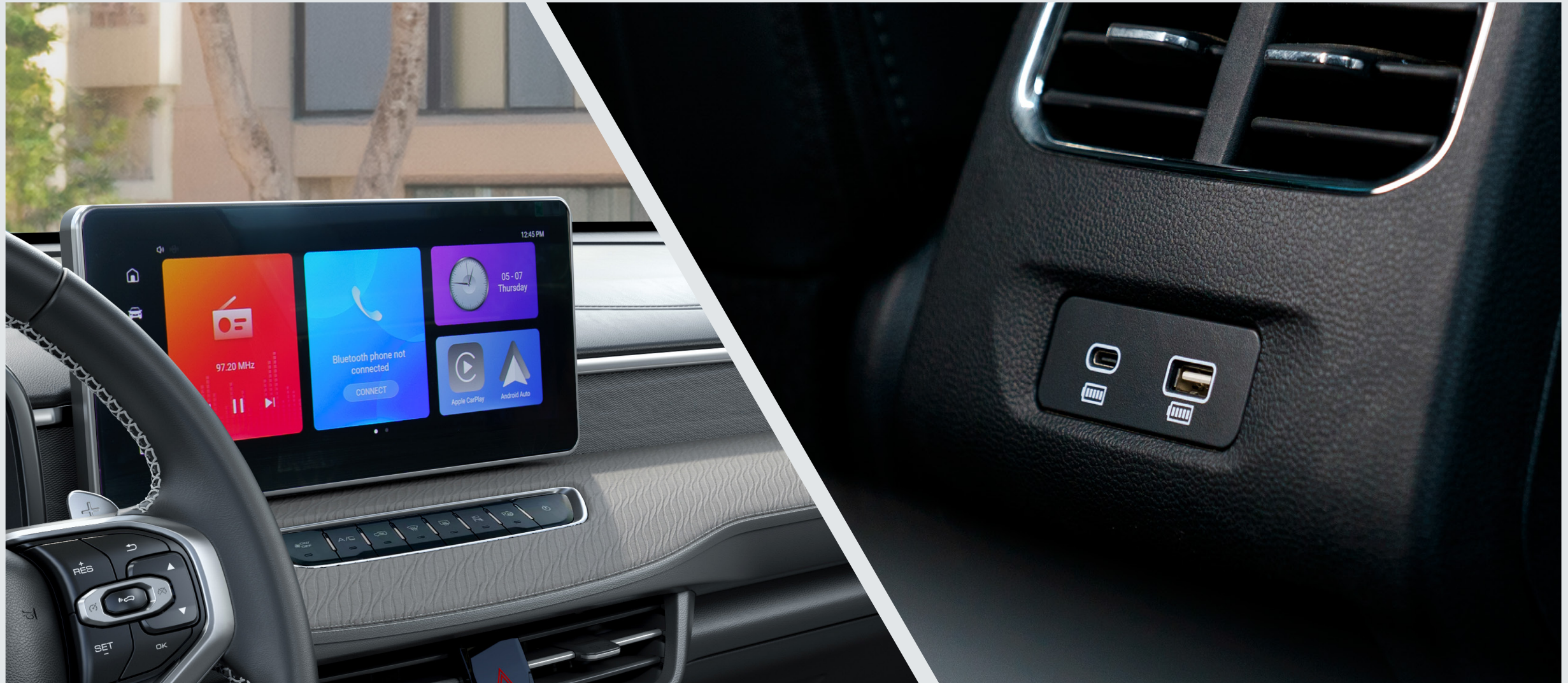
14.6" infotainment screen with wireless Apple CarPlay & Android Auto Connectivity.