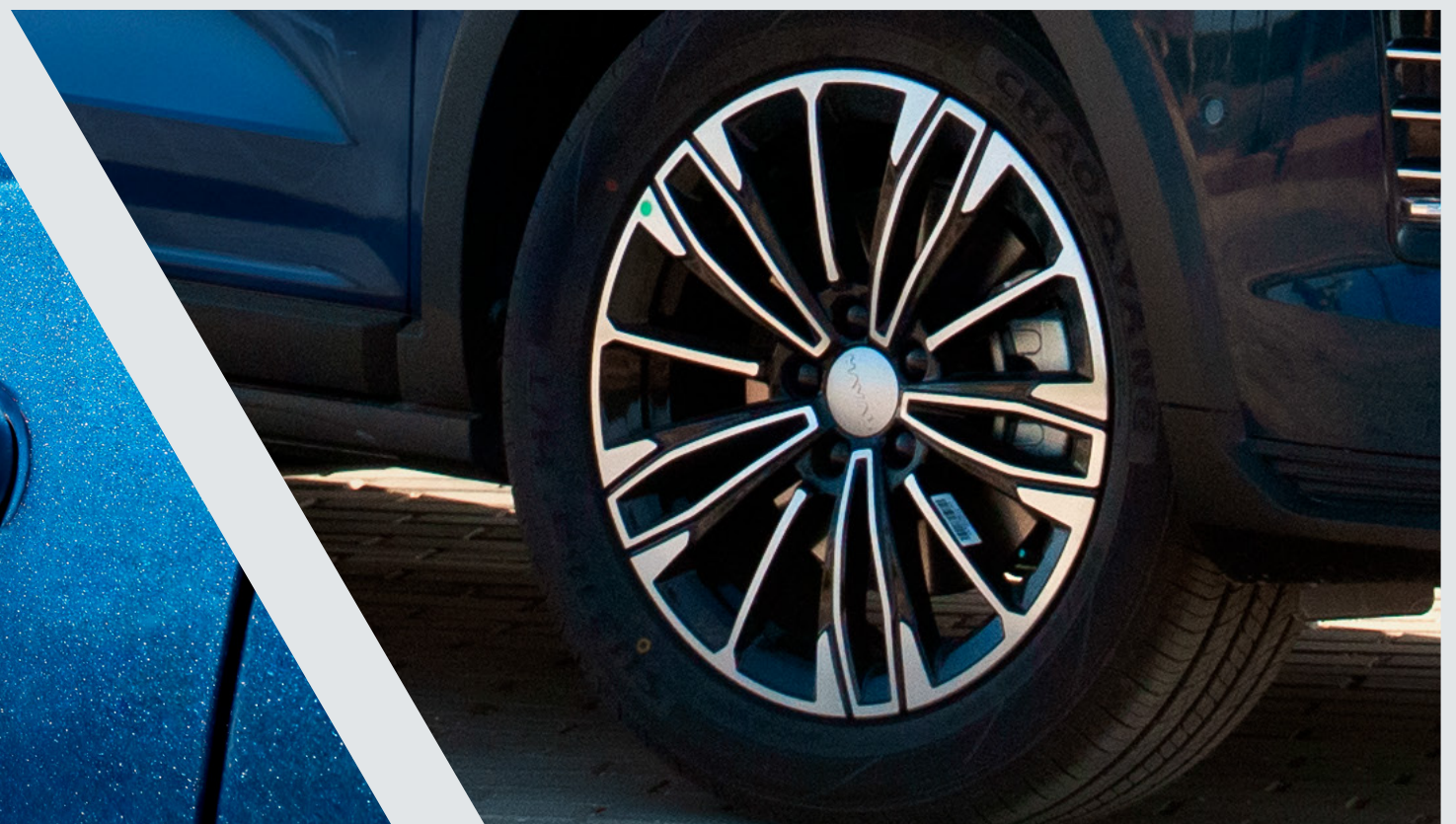
18" Alloy Wheels